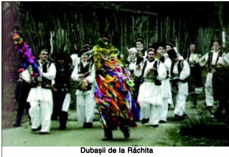
Dubașii de la Răchita

după o trudnică documentare. În privința conținutului nu vreau să intru în detalii, las pe seama cititorului să afle informațiile dorite. Totuși această monografie permite reconstituirea trecutului acestui sat, având meritul de a aduce într-o formă sintetică informația la zi și de a lămuri o serie de aspecte neclare din mai multe perioade istorice. Sunt convins că lucrarea nu este nici exhaustivă și nici perfectă, dar lăsăm generațiilor viitoare sarcina să o dezvolte